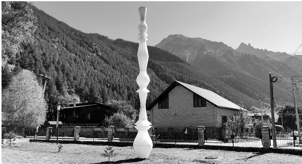
Вот так выглядит воплощенный в жизнь проект «Джаннат»