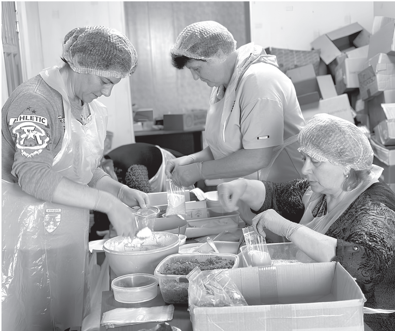
Работа по фасовке сухих супов и каш идет полным ходом